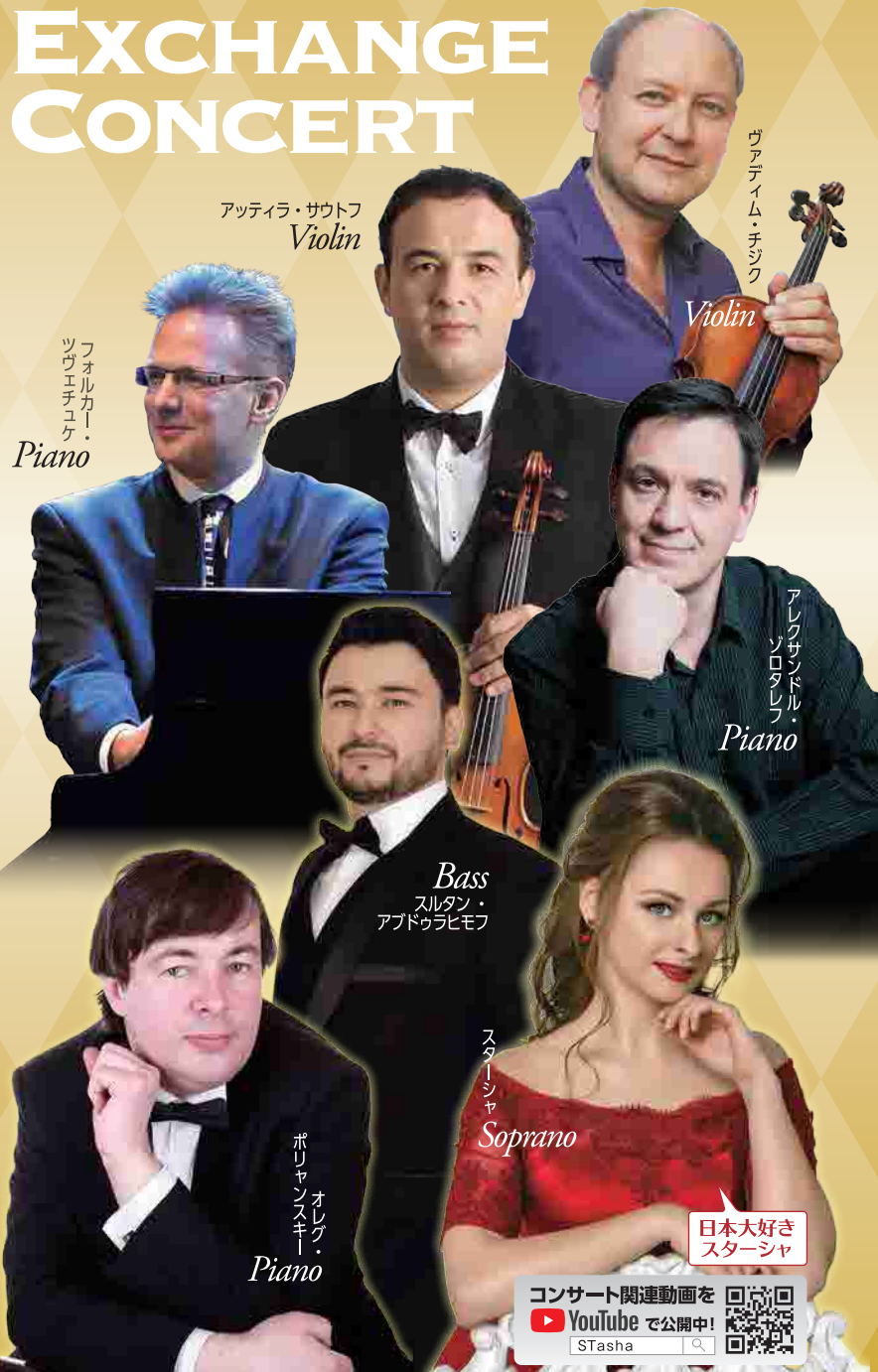
アッティラ・サウトフ Violin