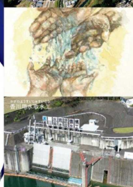
吉野川北岸用水取水工