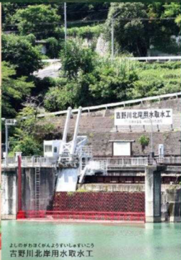
吉野川北岸用水取水工