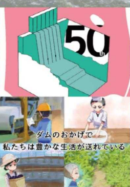
ダムのおかげで 私たちは豊かな生活が送れている