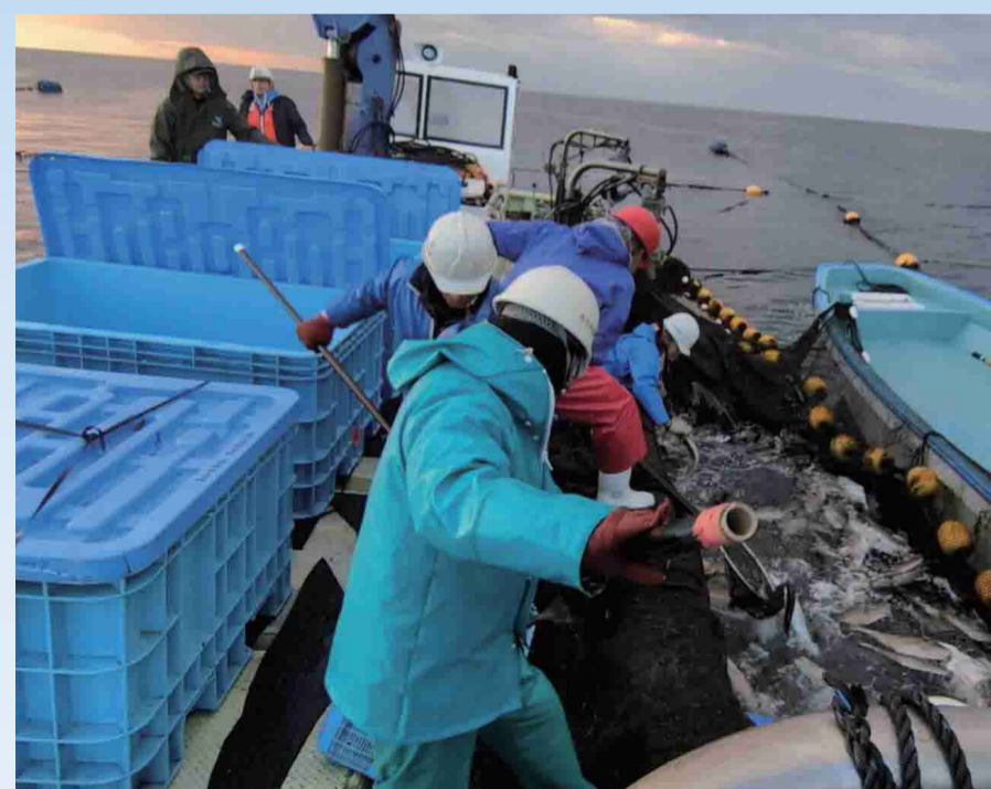
▲定置網漁風景(10年ぶり復活)