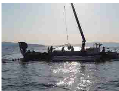
▲貝川定置網漁風景 輸出用▶