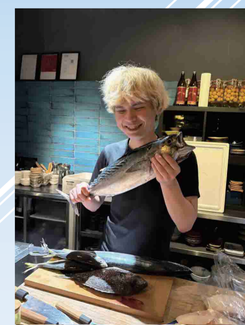
▲当社鮮魚を手にするシェフ(シンガポール)