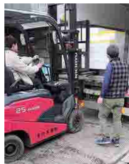
▼鮮魚便搬出の様子