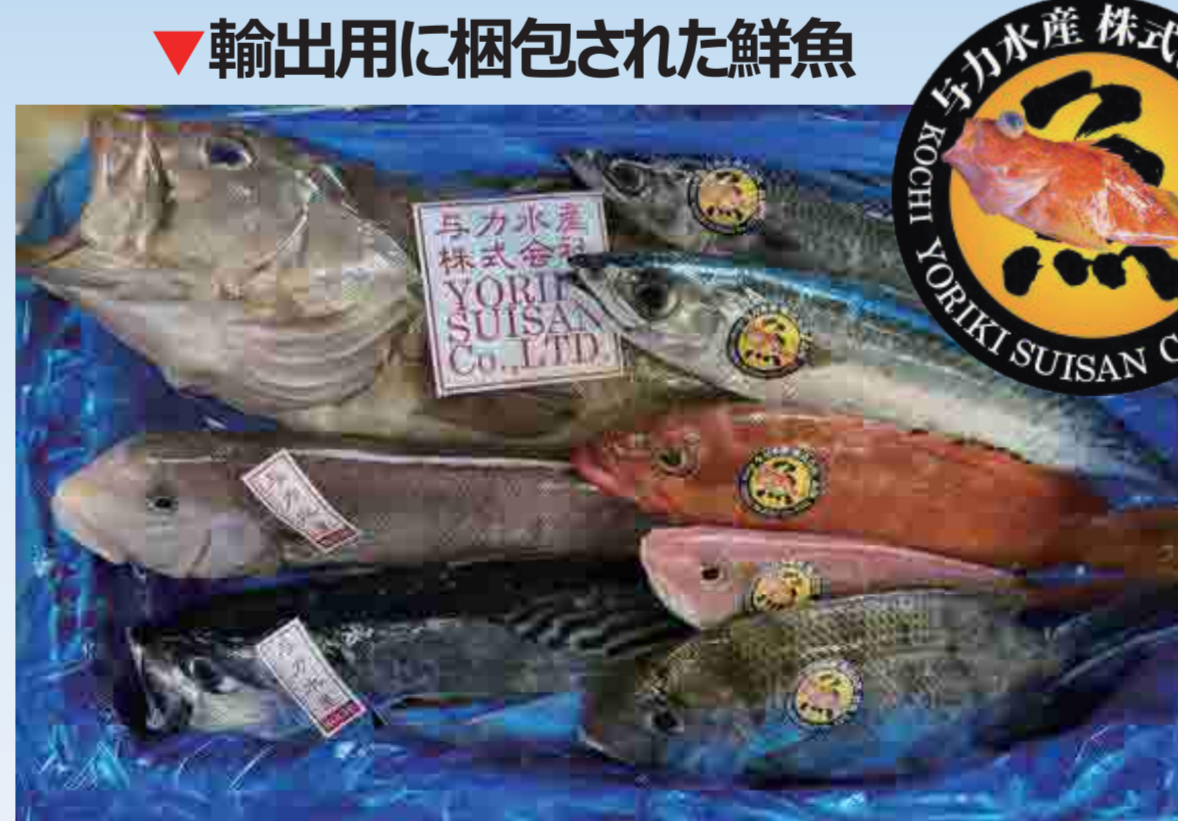
▼輸出用に梱包された鮮魚