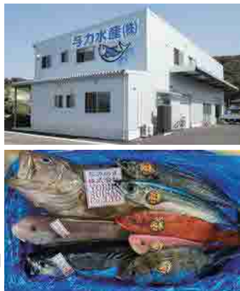
に梱包された自社取扱い鮮魚