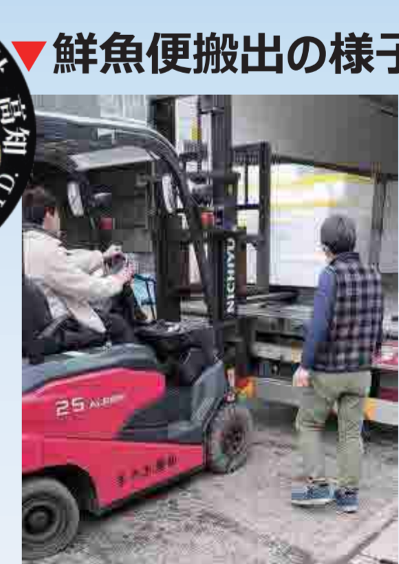
▼鮮魚便搬出の様子