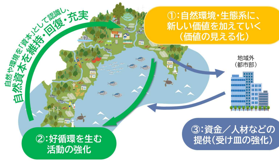
<本県における自然資本経営のイメージ図>