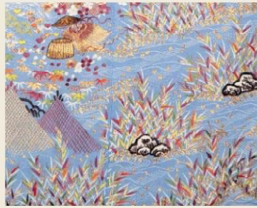
伝和宮所用 浅葱縮緬地松竹梅桜菊網干模様友禅染繡小袖 徳川記念財団所蔵 上品かつ色鮮やかな江戸風の小袖 後期は打掛を展示

久世広周書状写別紙 京都市歴史資料館所蔵 婚礼の道具につける紋の種類を老中の久世らが指示