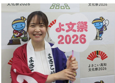
よさこい高知文化祭課 所属

異動先によって仕事内容が大きく変わるというのはやはり大変ではありますが、その様々な経験が積めますし、新しい事にチャレンジできる機会も多いです。皆さんと一緒に高知県を盛り上げられることを楽しみにしています!