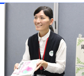
オーテピア高知図書館 所属

新しいことに挑戦するとき、課題にぶつかったとき図書館に来て下さい。きっとこのページをご覧になっている方は、高知県の職員になることを検討されている方だと思います。ぜひこれから受験勉強をしにオーテピア高知図書館に来ていただきたいです。