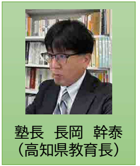
塾長 長岡 幹泰 (高知県教育長)