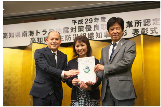
【写真】 社会福祉法人秦ダイヤライフ福祉会 特別養護老人ホームあざみの里 様

審査項目は、災害発生後も事業を継続することができるかどうかを問う「事業継続の視点」、社員に十分な防災教育を行っているかどうかを問う「社員教育の視点」、最後に、地域と連携した防災活動ができているかどうかを問う「地域貢献の視点」からなります。「社員教育、地域貢献の視点」の内容により星の数が異なりますが、どれか1つでも基準に達していなければ認定はされません。そのため認定事業所は、災害時にたよりになる存在です。県民の皆さまも、施設を利用する際など、選択理由の一つの指標として優良取組事業所に認定されているかどうかを確認してみたいはいかがでしょうか。