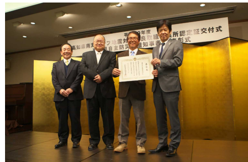
【写真】 南地区防災連絡協議会 様

皆さまのお住まいの地域でも、こういった地域を参考に継続的に訓練等を行う方法を検討してみたいはいかがでしょうか。