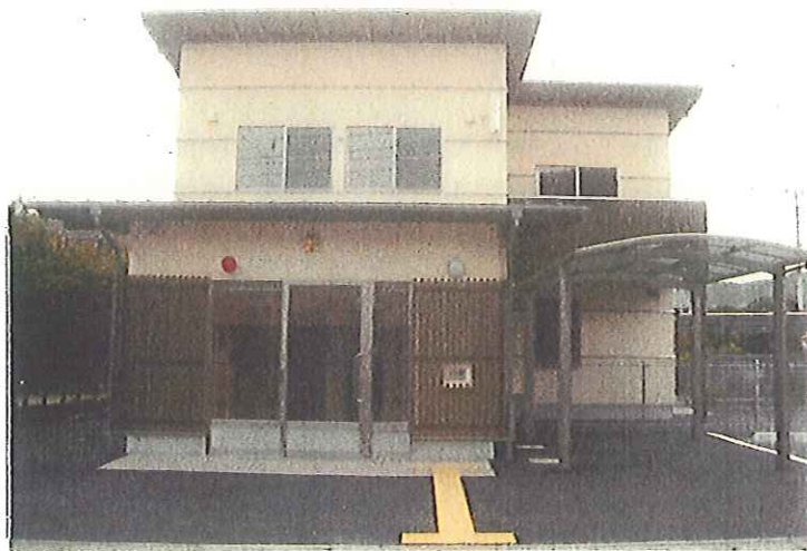
平成24年3月30日 完了状況 外観南面