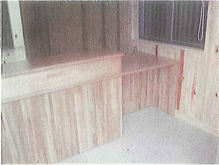
平成24年3月30日 完了状況 内観 公用部 事務室