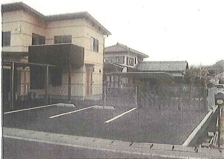
平成24年3月30日 完了状況 外観東面