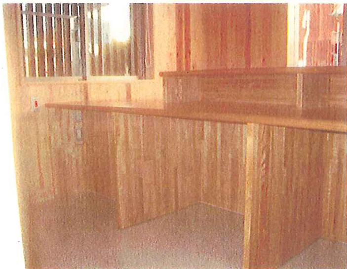
平成24年3月30日 完了状況 内観 公用部 事務室