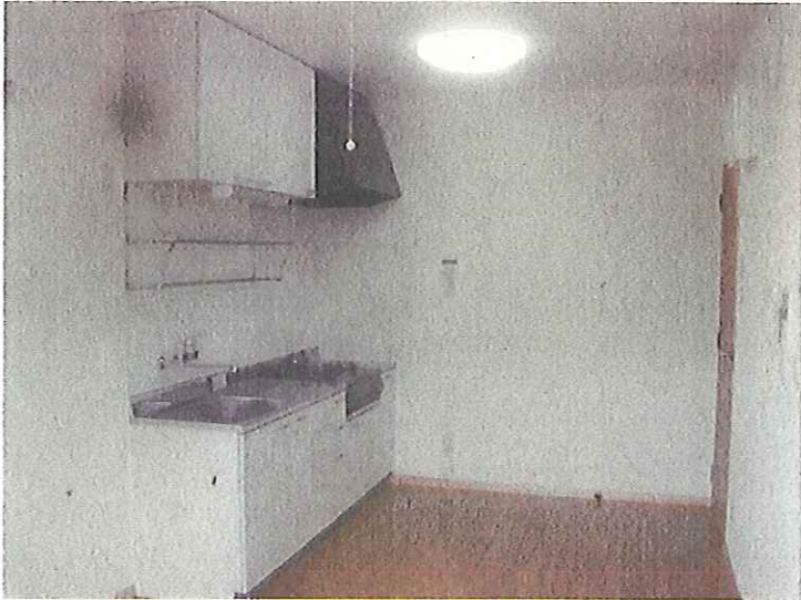
平成24年3月30日 完了状況 内観 住宅部2階 DK