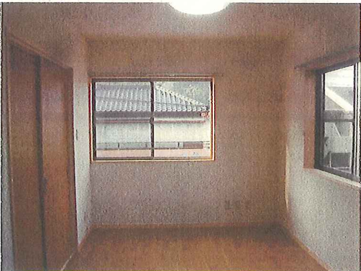
平成24年3月30日 完了状況 内観 住宅部2階 DK