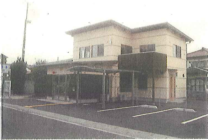
平成24年3月30日 完了状況 外観東面