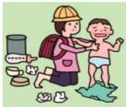
家族に代わり、幼いきょうだいの世話をしている