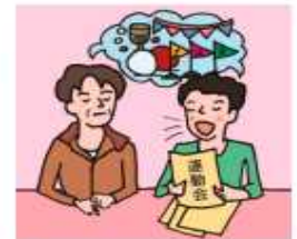
日本語が第一言語でない家族や障がいのある家族のために通訳をしている