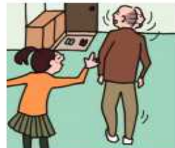
目を離せない家族の見守りや声かけなどの気づかいをしている