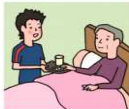
がん・雑病・精神疾患など慢性的な病気の家族の看病をしている