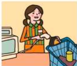
家計を支えるために労働をして、障がいや病気のある家族を助けている