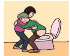
障がいや病気のある家族の入浴やトイレの介助をしている

©一般社団法人日本ケアラー連盟 / illustration : Izumi Shiga