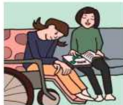
障がいや病気のあるきょうだいの世話や見守りをしている