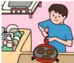
障がいや病気のある家族に代わり、買い物・料理・掃除・洗濯などの家事をしている

家族のお世話や家事を手伝うことは素晴らしいことですが、過度な負担によって、学業や健康、将来の進路に影響が出ることも心配されます。