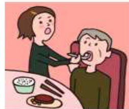
障がいや病気のある家族の身の回りの世話をしている