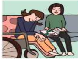
障がいや病気のあるきょうだいの世話や見守りをしている