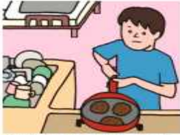
障がいや病気のある家族に代わり、買い物・料理・掃除・洗濯などの家事をしている

家族のお世話や家事を手伝うことは素晴らしいことですが、過度な負担によって、学業や健康、将来の進路に影響が出ることも心配されます。