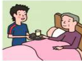
がん・難病・精神疾患など慢性的な病気の家族の看病をしている