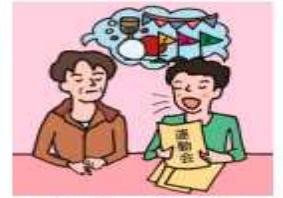
日本語が第一言語でない家族や障がいのある家族のために通訳をしている