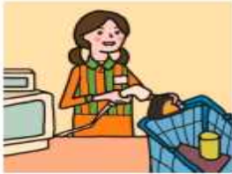
家計を支えるために労働をして、障がいや病気のある家族を助けている