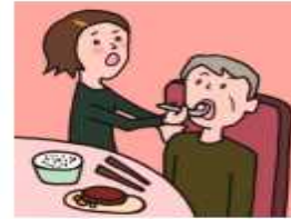
障がいや病気のある家族の身の回りの世話をしている