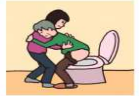
障がいや病気のある家族の入浴やトイレの介助をしている

©一般社団法人日本ケアラー連盟 / illustration : Izumi Shiga