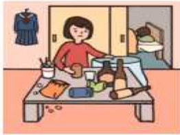
アルコール・薬物・ギャンブル問題を抱える家族に対応している