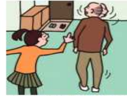
目を離せない家族の見守りや声かけなどの気づかいをしている