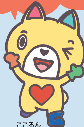
こころん 高知県人権啓発センター 人権啓発マスコットキャラクター