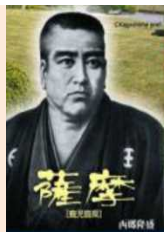
佐賀城本丸歴史館(佐賀市)