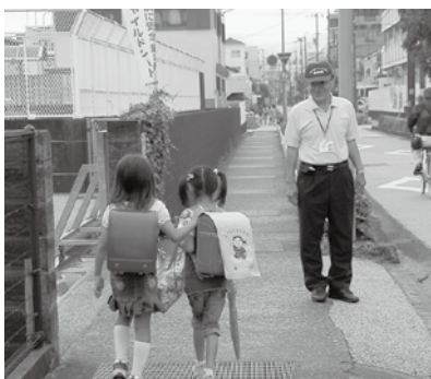
スクールガード・リーダーの活動の様子

スクールガード・リーダーは、子どもたちが安全で安心して学校で教育が受けられるようにするために学校を巡回し、学校内や通学路の安全確保、学校に対する指導助言を行っています。