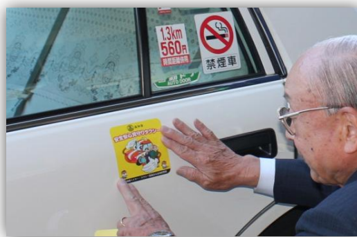
見守り活動に参加するタクシーにはステッカーが貼られます