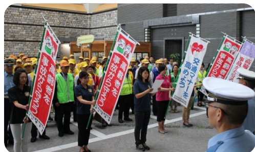
高齢者交通事故防止キャンペーン開始式(県警本部)

悲惨な交通事故がなくなるよう、運転時には早めのライト点灯、外出時には反射材の着用を心掛けてください。