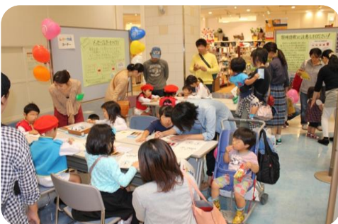
ひろば当日の様子です(イオンモール高知)

「犯罪や事故のない安全で安心して暮らせる地域社会づくり」を目的として、高知県安全安心まちづくり推進会議は10月18日(日)、イオンモール高知で「安全安心まちづくりひろば～みんなであそぶ安全安心の高知家～」を開催しました。