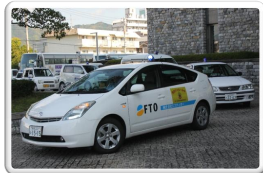
パトロール中は、上記マグネットを車両に貼り付けて活動しています