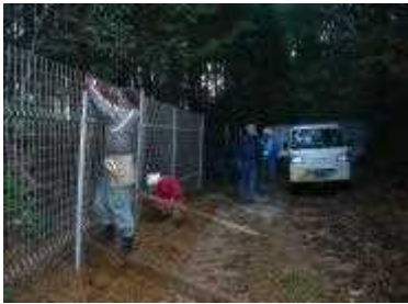
鳥獣害防護柵設置