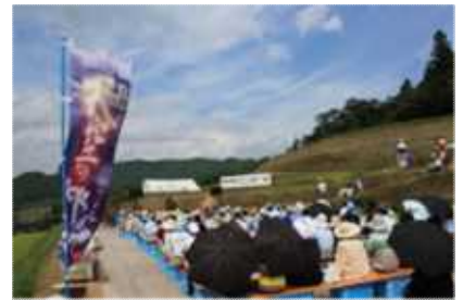
棚田コンサートでの交流活動