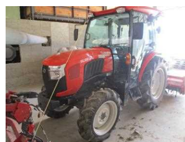
大型機械の導入(トラクター)