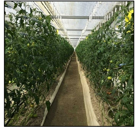
高糖度（シュガー）トマトハウス