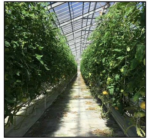
大玉（ロック）トマトハウス