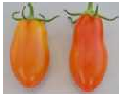
品目：ミニトマト 症状：果実が細長く変形