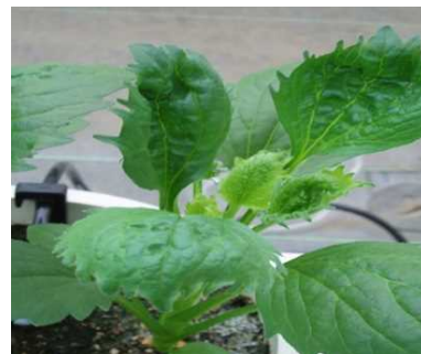
品目：アスター 症状：葉の異常