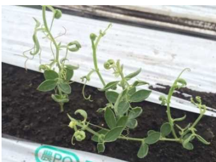
品目：スイートピー 症状：葉の異常