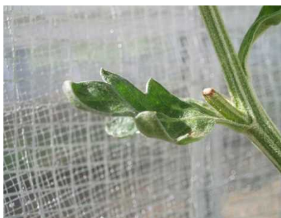
品目：きく 症状：葉の異常