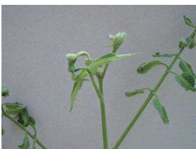
品目：トマト 症状：葉の異常