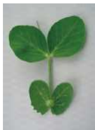
わずかにカップ状 =0.5