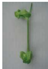
ひどく変形し原型をとどめない =3