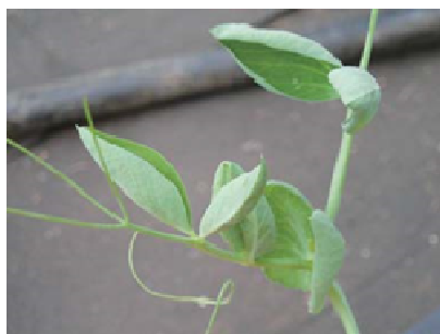
品目：さやえんどう 症状：葉がカップ状になる