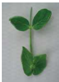
明らかにカップ状 =1