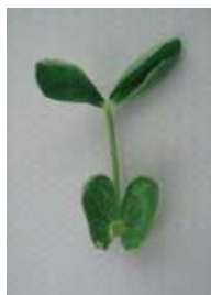
カップ状からさらに変形 =2