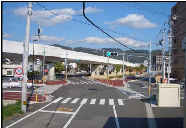
連立第20-18号 JR土讃線連続立体交差事業 比島交差点改良工事