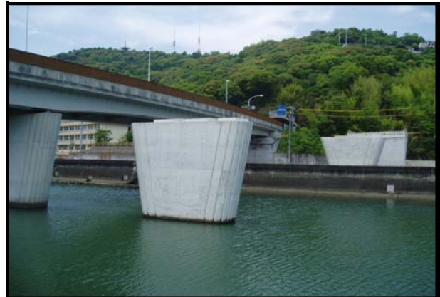
道改地第2-8号 県道高知南インター線 道路改築(坂本橋下部工P2)工事