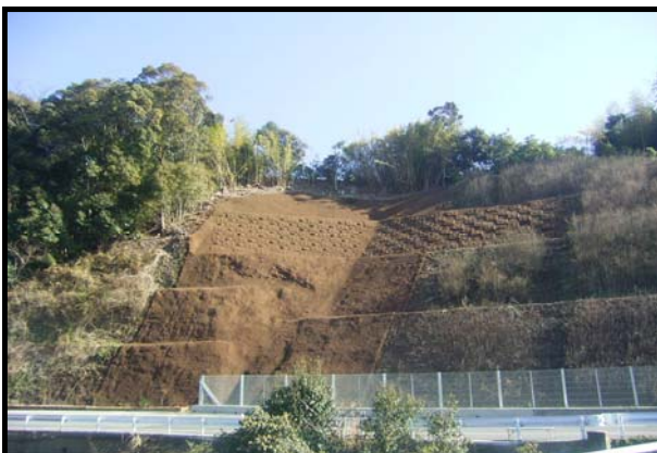
道交地(改築)第11-004-2号 県道羽尾琴浜線 地域活力基盤創造交付金工事