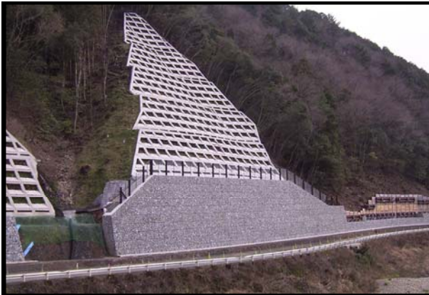
道交地(交安)第24-021-3号 県道窪川船戸線 地域活力基盤創造交付金工事