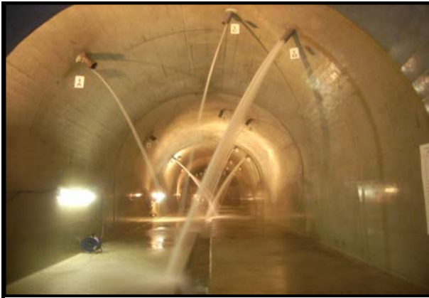
19災第2-3号 長者地区地すべり防止施設災害復旧工事