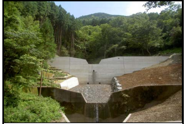
奥地第201-5号 大川(小南川)奥地保安林保全緊急対策工事