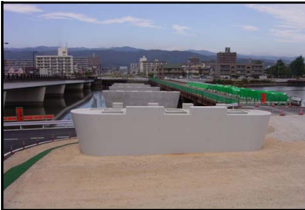
道改地第2-7号 県道高知南インター線道路改築 (絶海池橋下部工P1～P5)工事