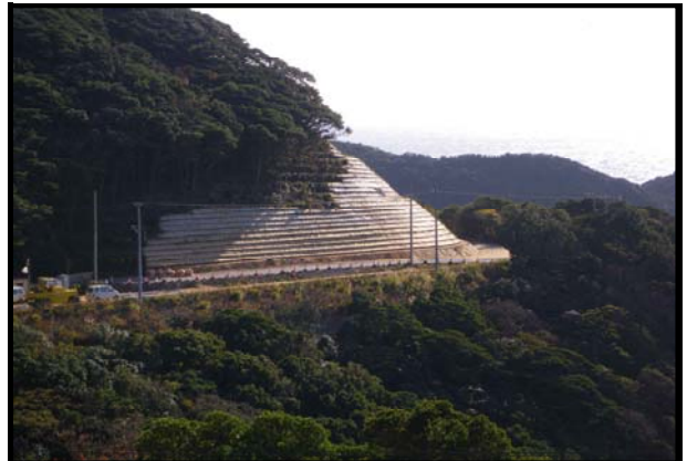
交安地第34-005-2号 県道柏島二ツ石線 交通安全施設等整備工事