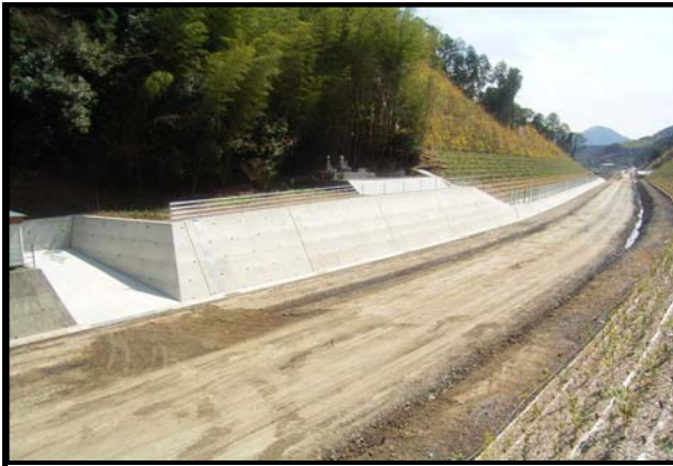
道改国第6-8号 国道494号道路改築工事