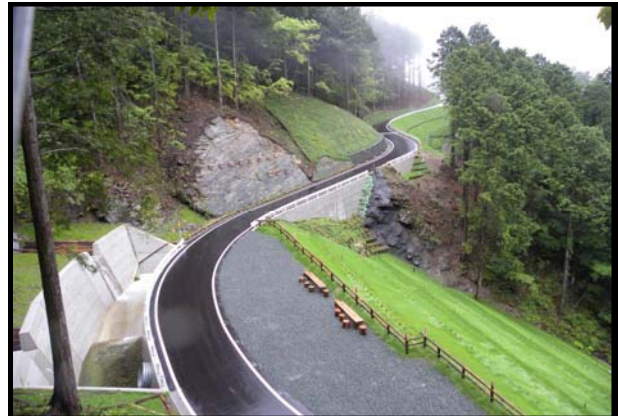
基幹第6号 森林基幹道開設事業長沢川口線3工区工事