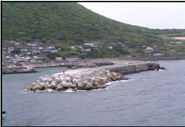
漁広域第4-2号 沖の島漁港(弘瀬) 広域水産物供給基盤整備工事