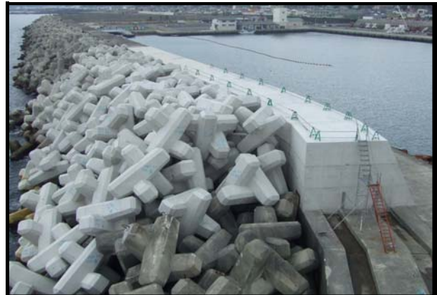
漁広域第1-1号 室戸岬漁港広域水産物供給基盤整備工事