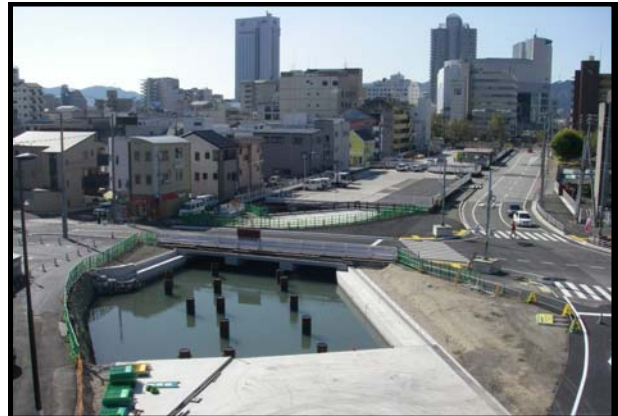
住促街第1-1号 都市計画道路はりまや町一宮線 住宅宅地関連公共施設整備工事