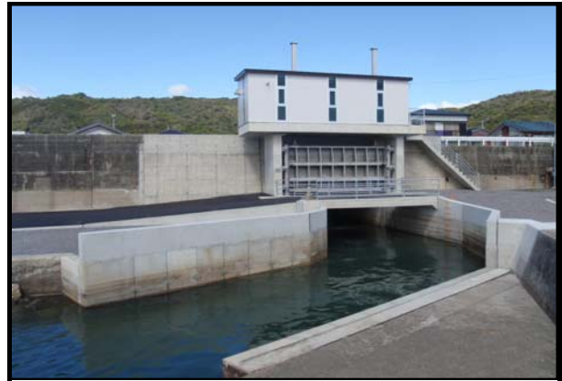
床上第1-005号 萩谷川(新町川防潮水門) 床上浸水対策特別緊急工事