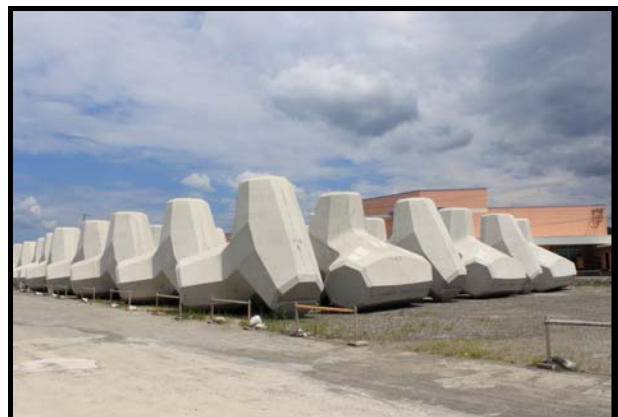
漁地域第1-4号 加領郷漁港 地域水産物供給基盤整備工事