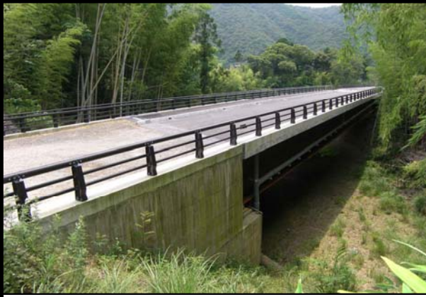
道改国第4-3-1号 国道441号道路改築(川登3号橋上部工)工事