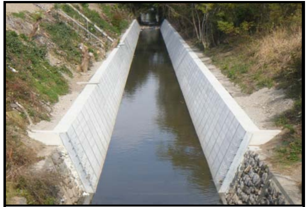
農基第872-103号 十市地区経営体育成基盤整備水路工事