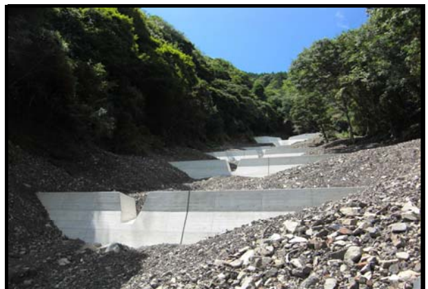
復旧第2号 弘瀬復旧治山工事