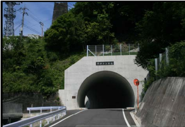
道交第22-011-1号 県道石鎚公園線 地方道路交付金(長沢トンネル)工事