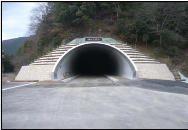
道改国(債)第5-1-1号 国道441号道路改築(網代トンネル)工事