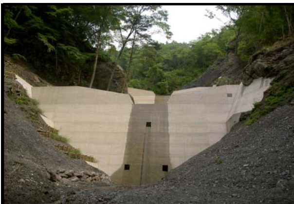
漁場保全第702-2号 下名野川No.2奥地保安林保全緊急対策工事