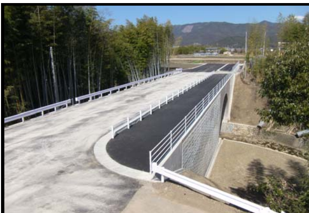
交安地(統合)第1-6号 県道宮ノ口深淵線 交通安全施設等整備工事