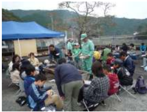
昼食 (バーベキュー)