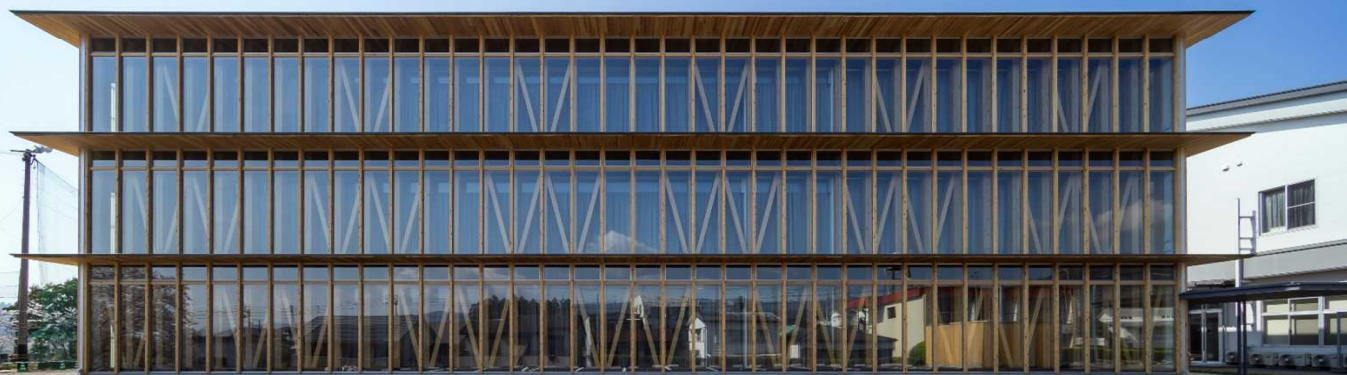
高知学園大学 — 設計: 艸建築工房