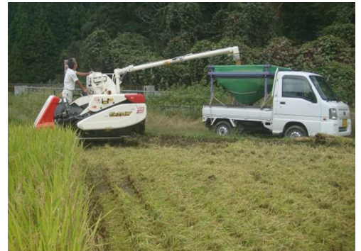
事業導入のコンバインで収穫