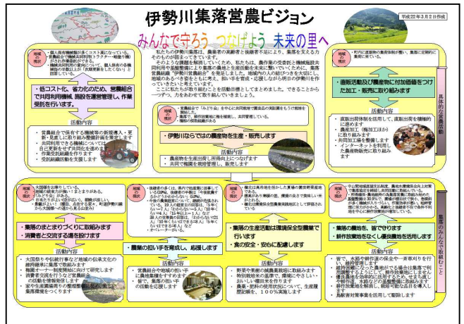
伊勢川集落営農ビジョン(平成22年3月作成)