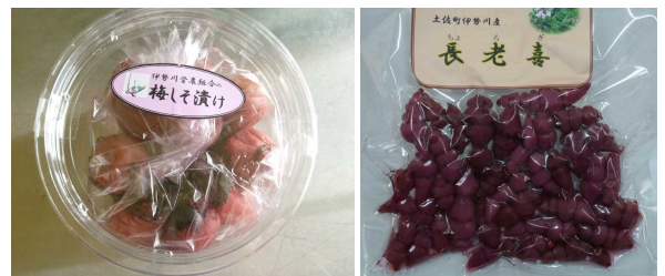
加工品(梅しそ漬け、チョコロギ梅酢漬け)