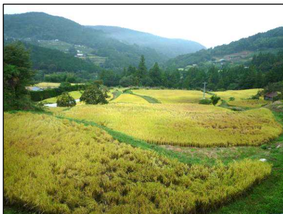
集落の斜面には棚田が広がる

梅 0.2 ha チョロギ 0.04 ha 作業受託 畦塗り 1.03 ha 田植え 4.87 ha 防除 4.92 ha