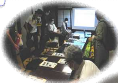
内子町や大洲市での 現地研修の様子