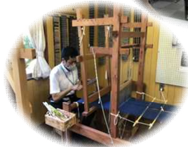
さきおり 伊方町では裂織体験 をしました。

社会教育主事講習は、社会教育法(昭和24年法律第207号)第9条5の規定及び社会教育主事講習等規定(昭和26年文部省令第12号)に基づき実施するもので、社会教育主事の職務を遂行するに必要な専門的知識・技能を修得させ、社会教育主事となりうる資格を付与することを目的としています。