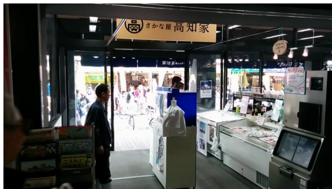
「さかな屋 高知家」前区画の様子 中通路から見た前区画の様子です。店舗は、中通路を挟んで、この前区画と後区画(加工場)で1店舗です。