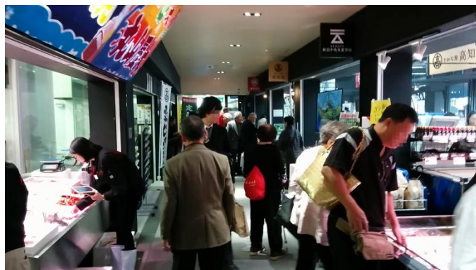
「築地につぼん漁港市場」施設内の様子 漁港市場の中通路の様子です。来場者は、この中通路を導線に回遊します。