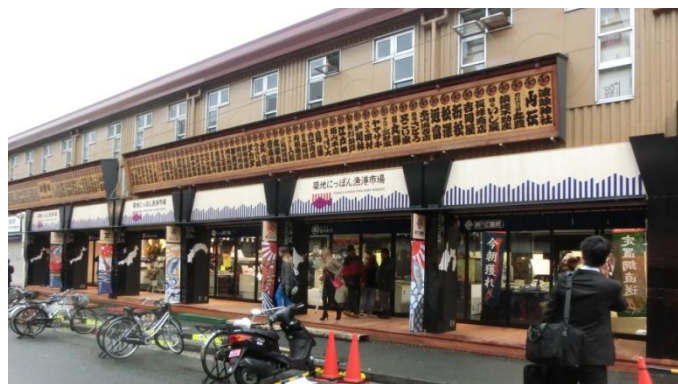
「築地につぼん漁港市場」施設の外観