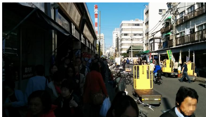
施設前「波除(なみよけ)通り」の賑わい 漁港市場の向いには行列ができる有名な卵焼店が並ぶなど、賑わいのある通りです。