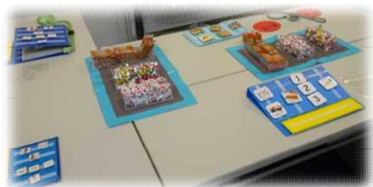
絵カードでのコミュニケーション

自閉症の方の捉え方や感覚を体験することで、特性に合わせた支援の大切さを知ることができます