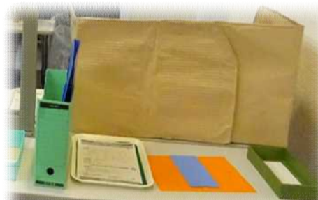
見ただけでやり方がわかる課題