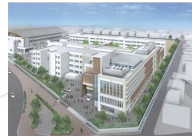
北西県道側からの全景