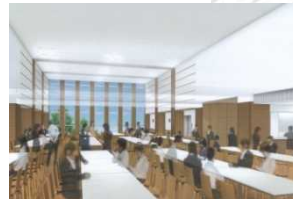
一部吹き抜けのランチルーム(3階)

中高共用の特別教室を中心に、発表会などが行えるステージも備えた“ランチルーム”や体育の授業や集会などが行える“多目的ホール”を整備。また、探究的な学習などに対応するため、少人数教室の整備や各階の廊下にスタディコーナーを配置する。