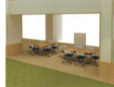
スタディコーナー(各階)