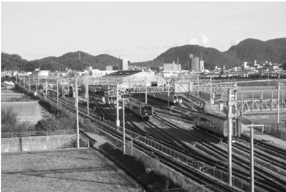
車両基地を土佐一宮駅方面から望む