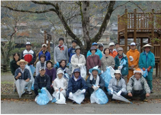
「仁淀川会場」 集合写真