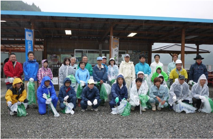
「日高村会場」 集合写真