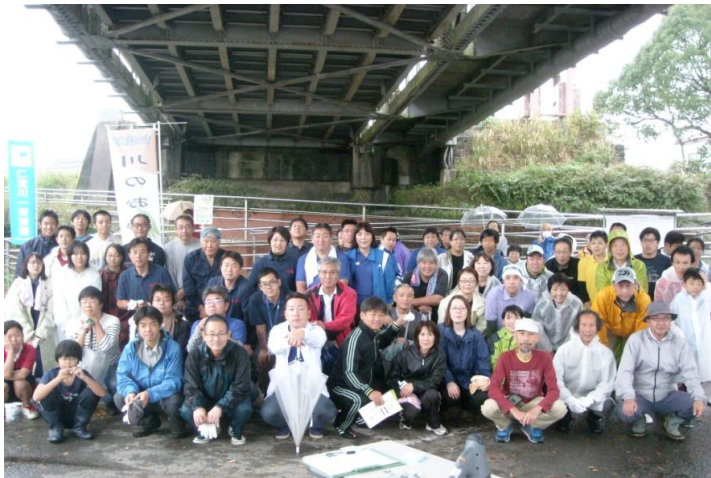
「いの町伊野会場」 集合写真