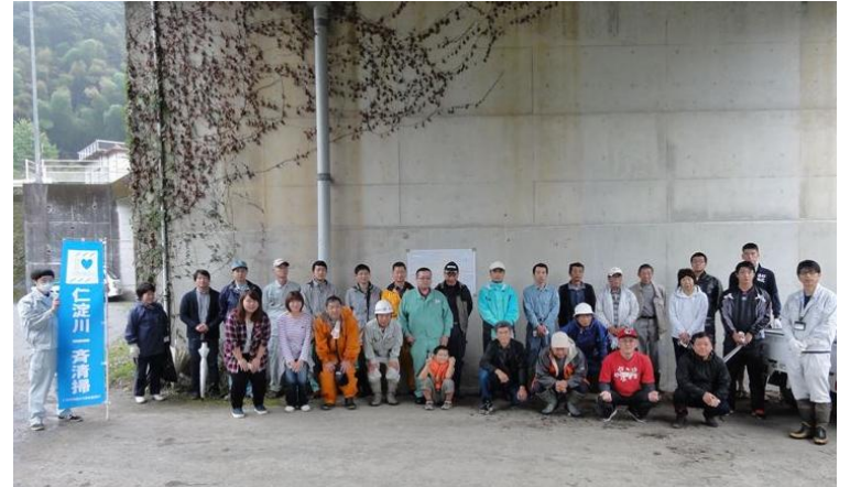
「いの町吾北会場」 集合写真