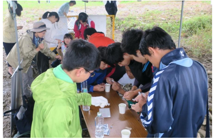
「佐川町・越知町会場」 パックテスト実施の様子