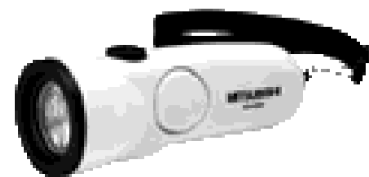
ライト付防犯ブザー